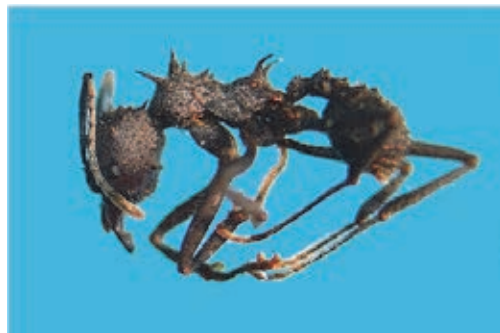
Fig. 3 Acromyrmex sp. (quenquém)