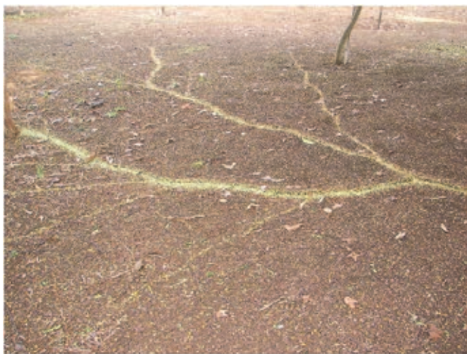
Fig. 8 Trilha de formigas cortadeiras