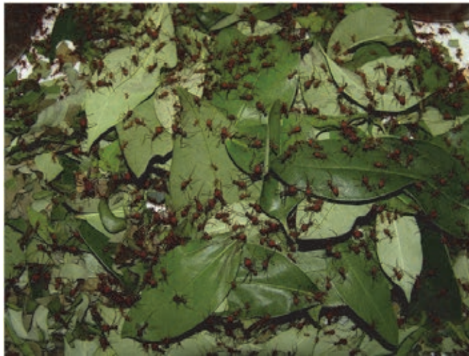
Fig. 7 Desfolha por saúva limão