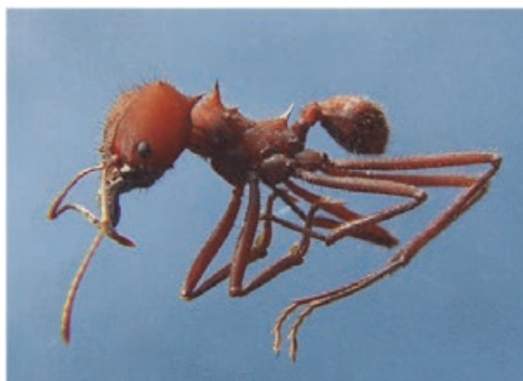
Fig. 2 Soldado de Atta sexdens (saúva limão)