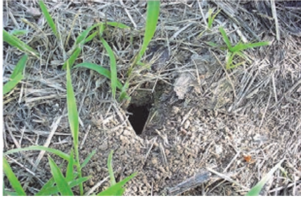
Fig. 6 Olheiro de saúva