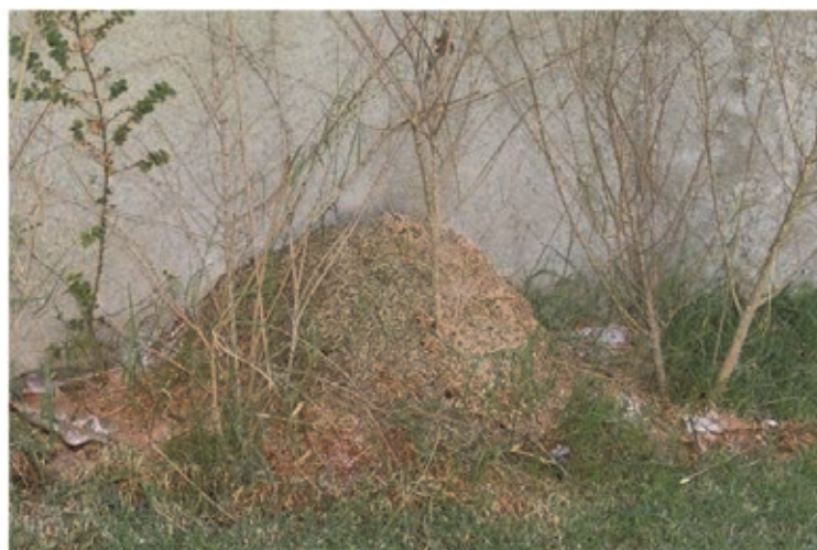
Fig. 5 Ninho de Acromyrmex (Quenquém)