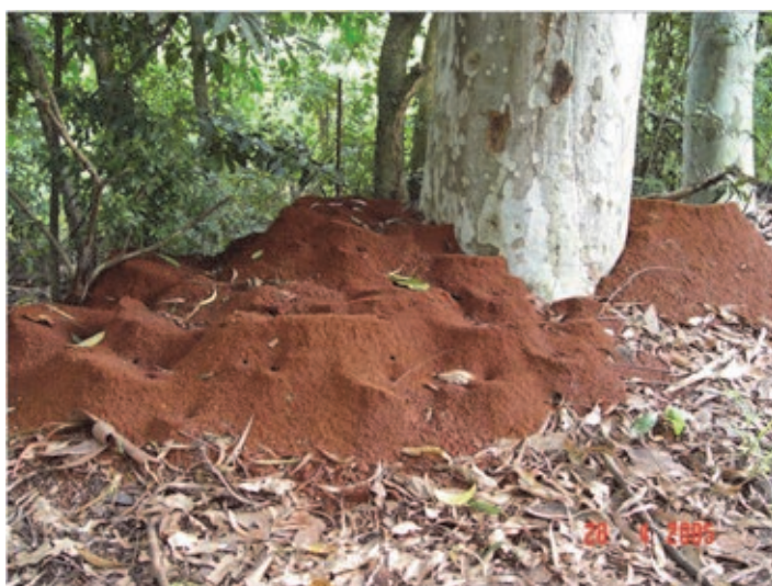
Fig. 4 Ninho de saúva limão (terra solta).