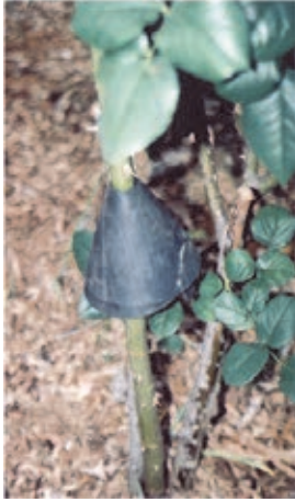
Fig. 9 Dispositivo anti-formigas-cortadeiras (cone invertido)